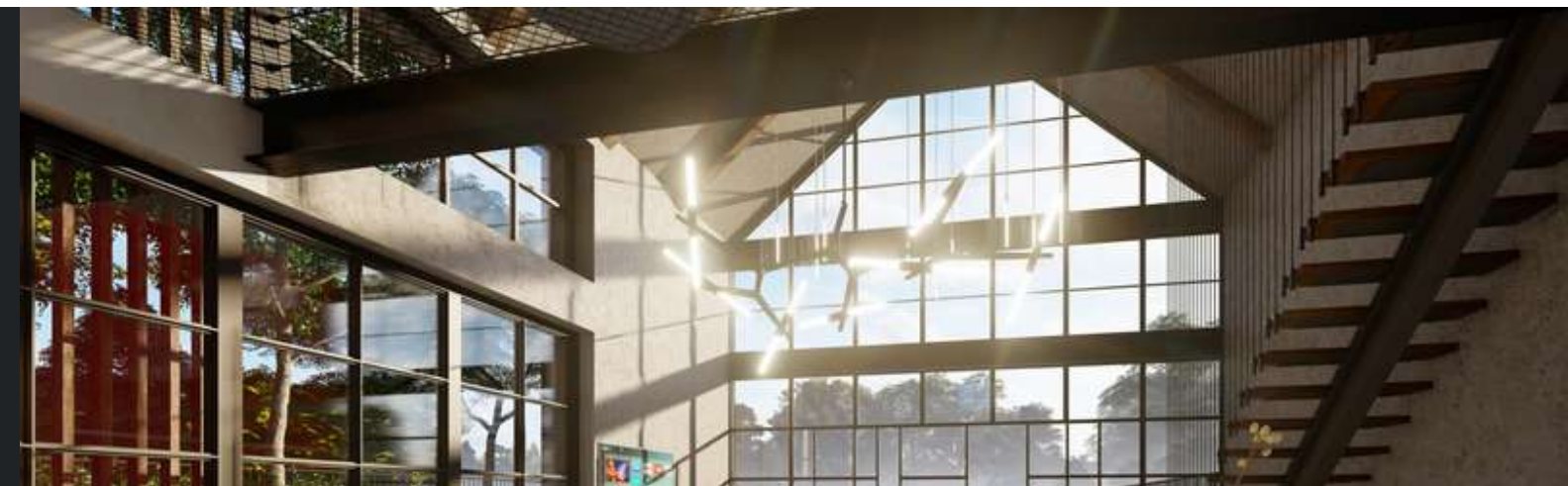
Konsultacje przy projekcie wnętrz Dom jednorodzinny, 2021 r.

Współpracę z ekipą z tego biura oceniam bardzo pozytywnie. Dużo ciekawych rozwiązań w projekcie, o których w życiu sam bym nie pomyślał. Widać duże doświadczenie w projektowaniu domków jednorodzinnych. Krótko mówiąc polecam.