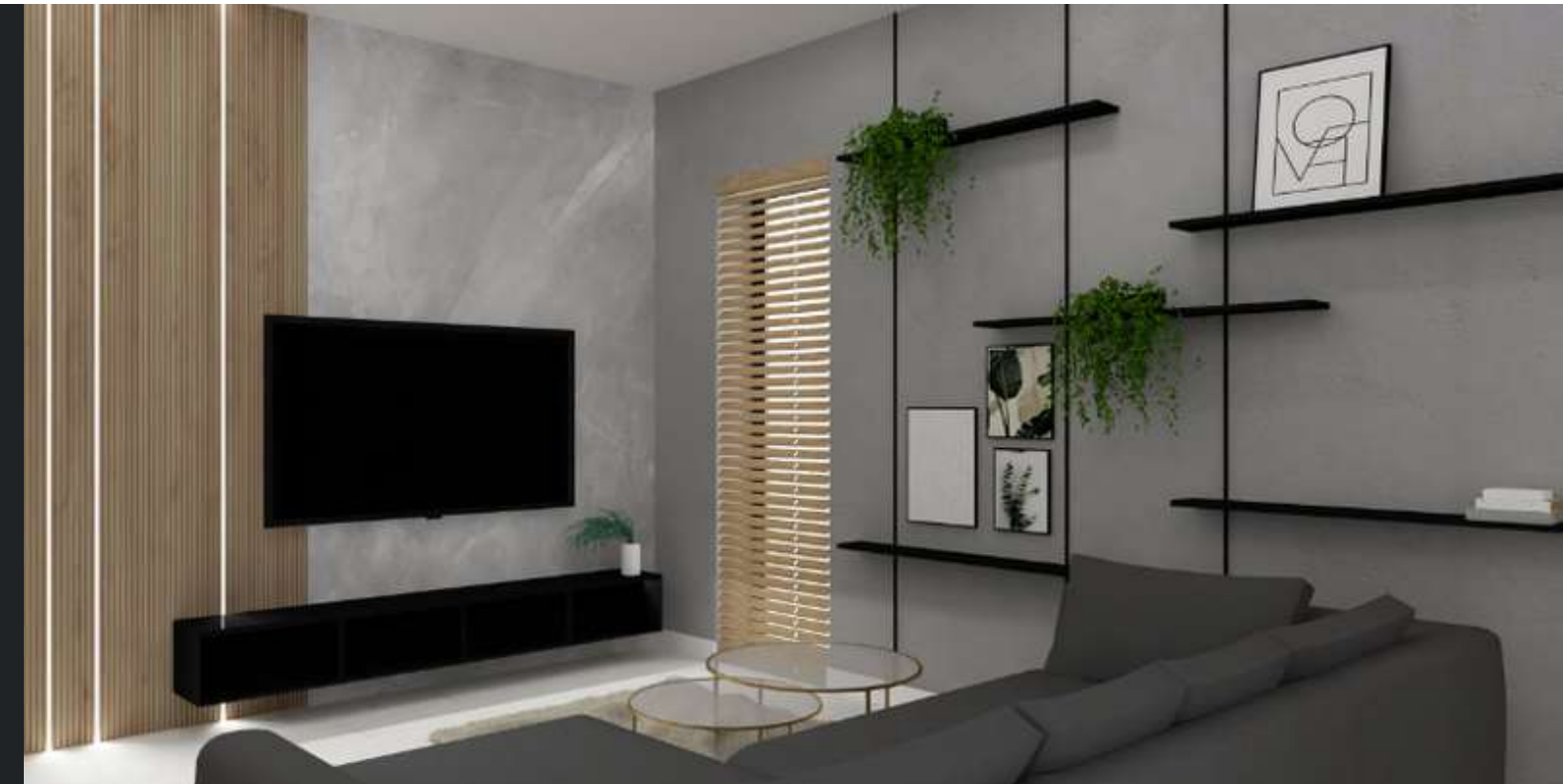
Projekt domu i wnętrza wnętrza, 2020 r.