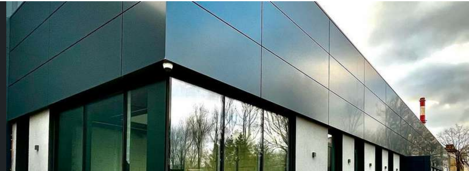
Stała współpraca od 2017 r.

Patrząc jak wielką inwestycją jest teraz budowa, myślę że warto iść w projekty nietypowe żeby dobrze wykorzystać możliwości działki. Ta pracownia temat mieszkaniówki ma rozpracowany na wylot. Bardzo ogarnięta i dobrze zorganizowana ekipa. Współpracujemy projektowo od jakiegoś czasu i szczerze polecamy.