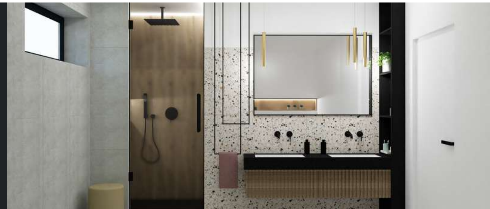
Stała współpraca od 2020 r.