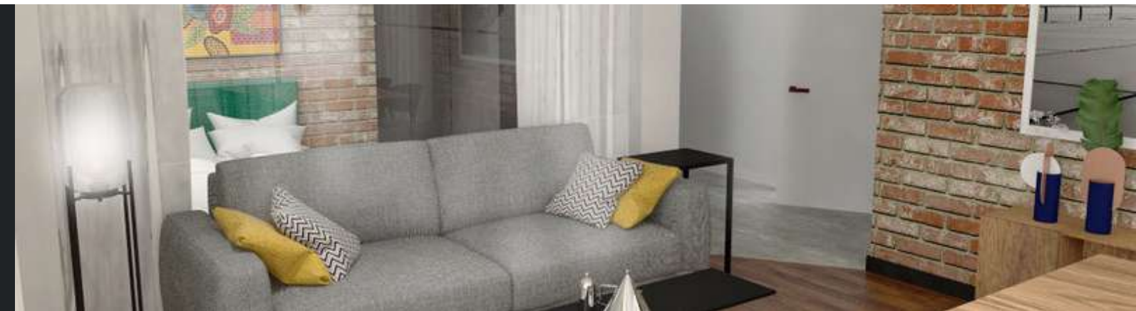
Konsultacje przy projekcie wnętrza mieszkania 2018 r.