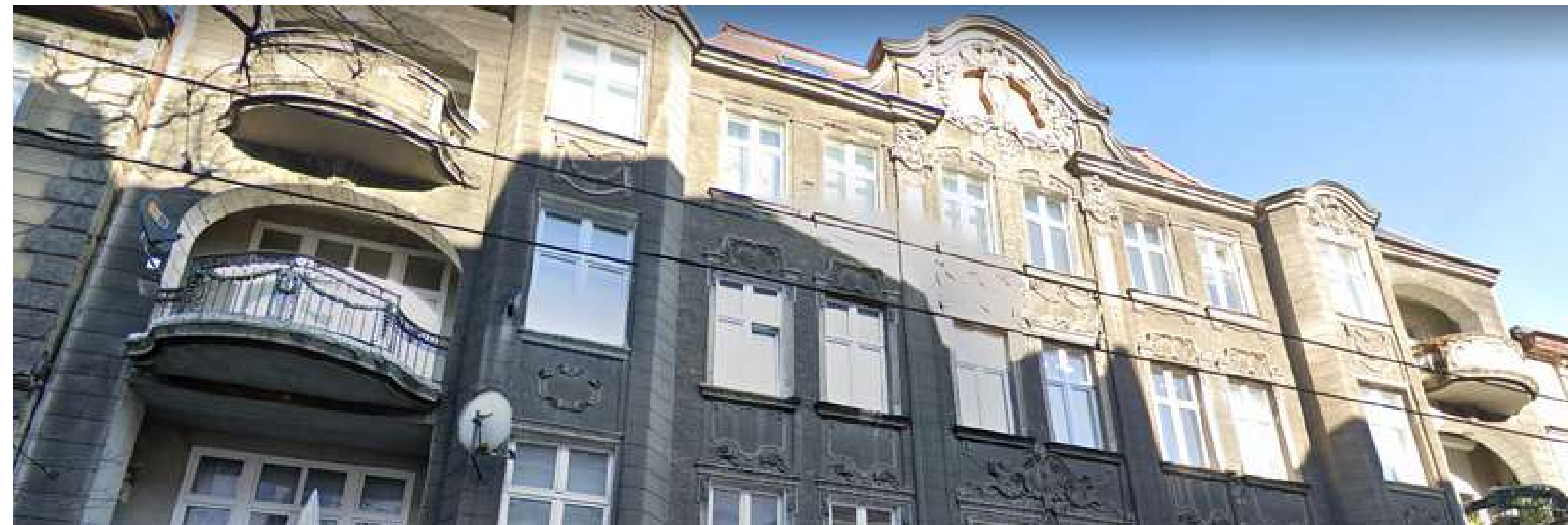
Street view obiektów