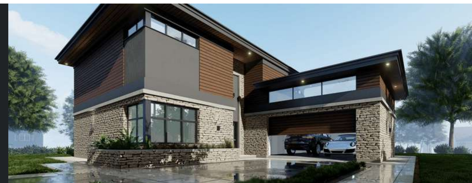
Projekt domu, rok 2021